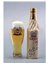
越乃米こしひかり仕込みビール